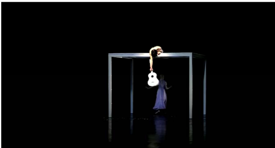
Nevidomá Dívka (Národní divadlo Praha, 2007)

capo, come per alludere a un pendolo che scandisce il tempo delle fiabe prima di addormentarsi. Egli allunga lo strumento alla ragazza, nel tentativo di farle intendere che è giunto il suo momento per danzare; le luci si abbassano e lo scena diventa opaca e ovattata, come in un giardino fatato. L'atmosfera richiama quella fiabesca della canzone e i movimenti dei danzatori corrispondono puntualmente alle parole del testo.