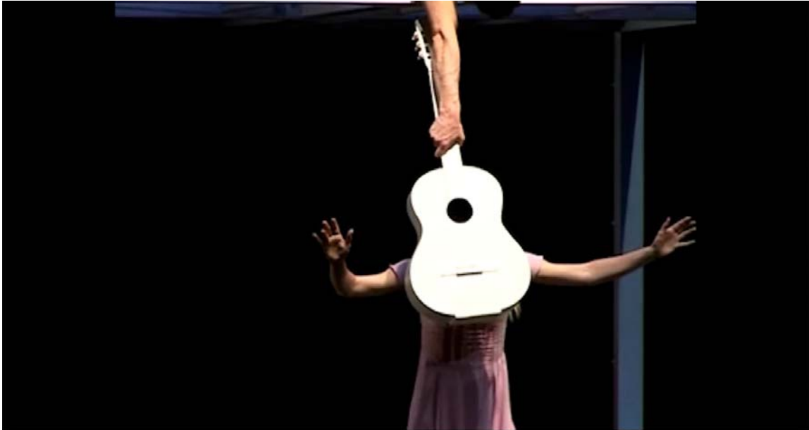
Nevidomá Dívka (Národní divadlo Praha, 2007)

A questo punto, in corrispondenza della terza strofa, inizia il ritornello della canzone che tornerà per tre volte. E qui la danza si limita a parafrasare allusivamente il contenuto dei versi, attraverso una serie di passi che esprimono la libertà del gioco in un mondo di sole e nuvole che la fanciulla “non vedrà mai”: jetés e ronds de jambe 4 evocano uno spazio aereo e spensierato, mentre il ballo marca degli arresti ritmici quasi a suggerire gli ostacoli incontrati in questa costruzione immaginaria (“Per favore, lasciatela stare, ah, lasciatela stare”). E il balletto, puntualmente, adotta schemi coreografici identici per mettere ‘in rima’ le strofe e il ritornello, con un elegante senso della simmetria che riproduce quella del testo di Kryl.